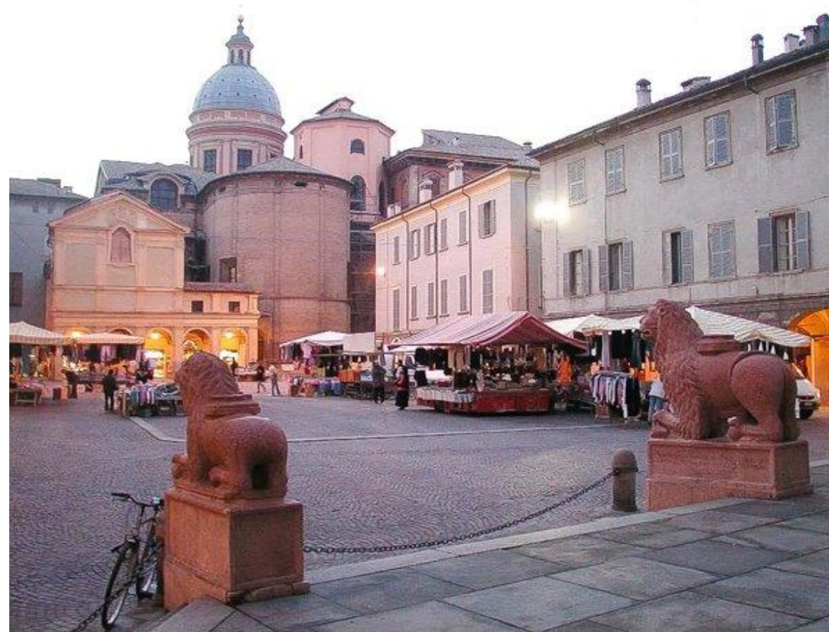
Piazza di S.Prospero w Reggio Emilia