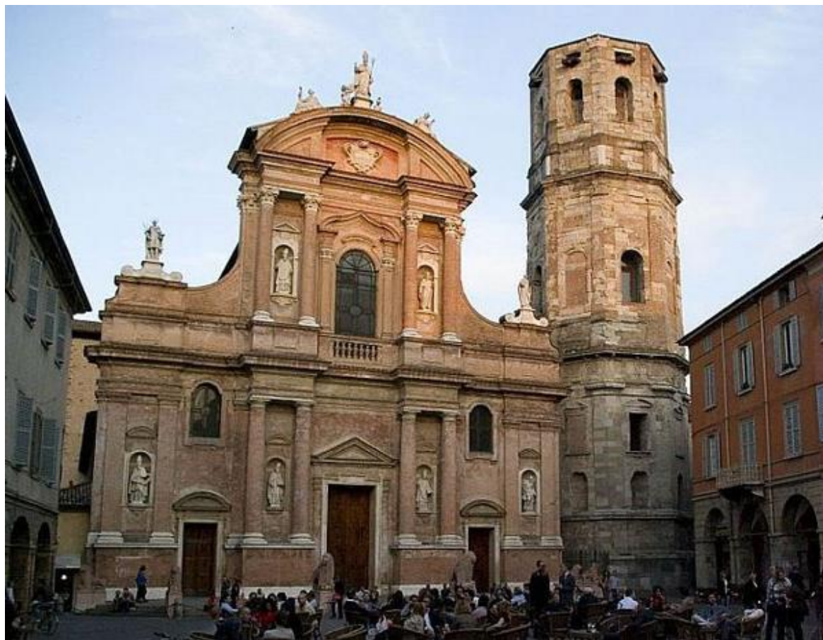
Basilica di San Prospero w Reggio Emilia